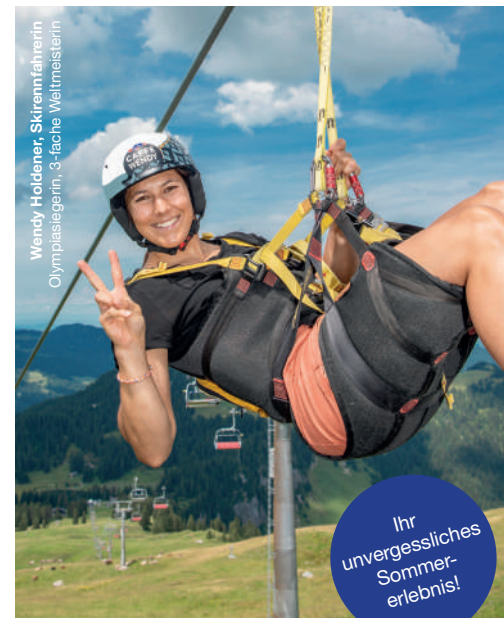
Wendy Holdener, Skirennfahrerin Olympiasiegerin, 3-fache Weltmeisterin

Gratis Spass für Kinder: Der grosse Spielplatz beim Restaurant Fuederegg ist ein besonderes Highlight. Auf die kleinen Gäste warten eine Hüpfburg, ein grosses Trampolin, ein Sandkasten, ein Spielturm und vieles mehr.